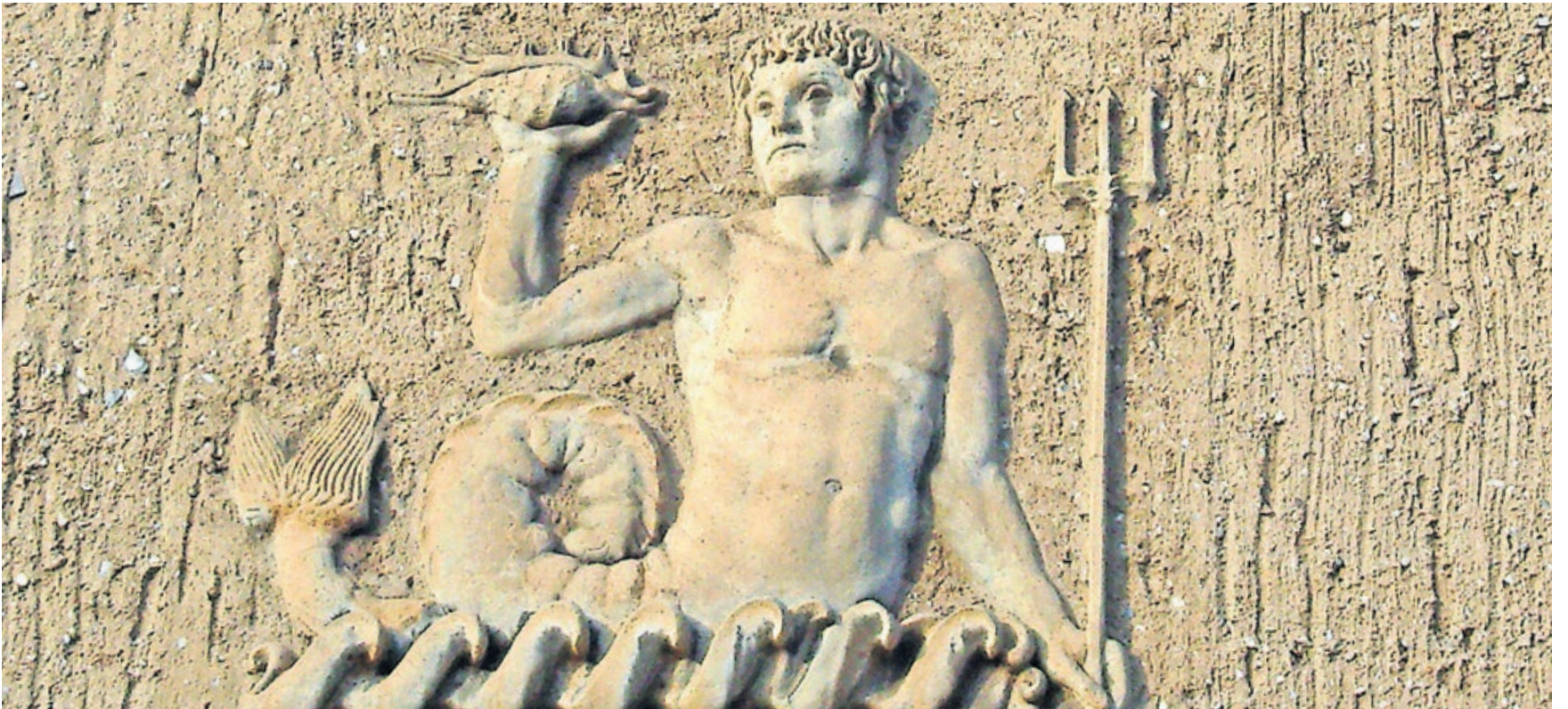
Endlich hat sich was getan beim Sachsenbad. DIE LINKE kämpft seit Jahren für die Wiederbelebung als Gesundheitsbad