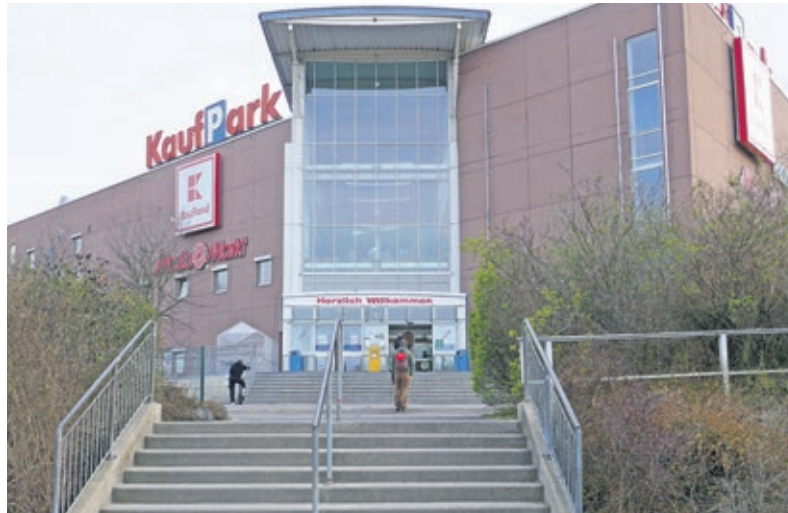
Der Kaufpark in Nickern im gegenwärtigen Zustand

Neben der notwendigen konzeptionellen Neuaufstellung ist auch von bau- und haustechnischen Problemen die Rede. Demnach sei die Haustechnik verschlissen und nicht mehr sanierbar. Was den bautechnischen Zustand anbelangt, gleicht ein Rundgang durch die Tiefgaragen und die Parkdecks einem Praktikum im Rahmen der Vorlesungsreihe Bauschäden »Rustikale Baubehelfe aus Stahl zur nachträglichen Unterstützung bröselnder Betonkonstruktionen«. Zei-