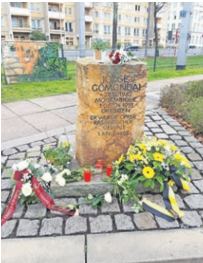
»Ihm zur Erinnerung, uns zur Pflicht«, ziert die Schleife des Blumengestecks der Linksfraktion