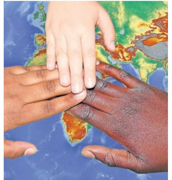
Integration muss staatlich gefördert werden und darf nicht allein durch ehrenamtliches Engagement getragen werden