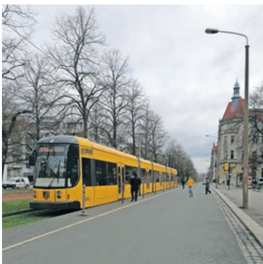
Der Haltestellenbereich der Linie 3 ist nur einer der Gefahrenpunkte an der Münchner Straße

D urch die Nähe zur Technischen Universität, den Durchgangsverkehr zur Autobahn 17, drei Straßenbahnhaltstellen, den Wochenmarkt, die Bibliothek, mehrere Einzelhandelsgeschäfte sowie angrenzende Wohngebiete mit mehreren Schulen und Kitas kommt es entlang der Münchner Straße zu einem erhöhten Verkehrsaufkommen. Das hohe Parkaufkommen sorgt in den Kreuzungsbereichen für eingeschränkte Sicht und es kommt immer wieder zu Verkehrsunfällen, oft mit Beteiligung der Straßenbahn.