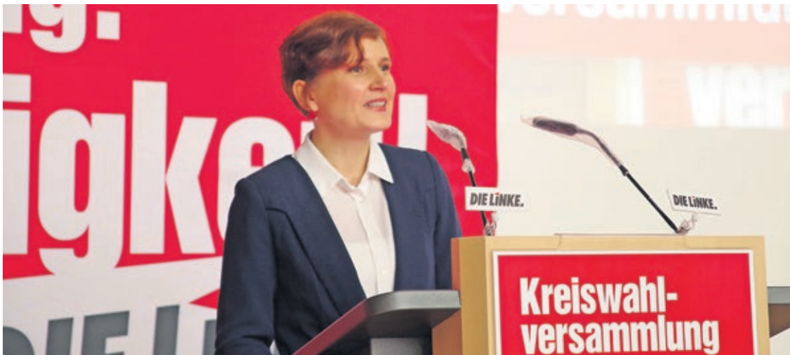
Bilanz als Bewerbung: Katja Kipping bei ihrer Vorstellung vor den Dresdner Genoss:innen