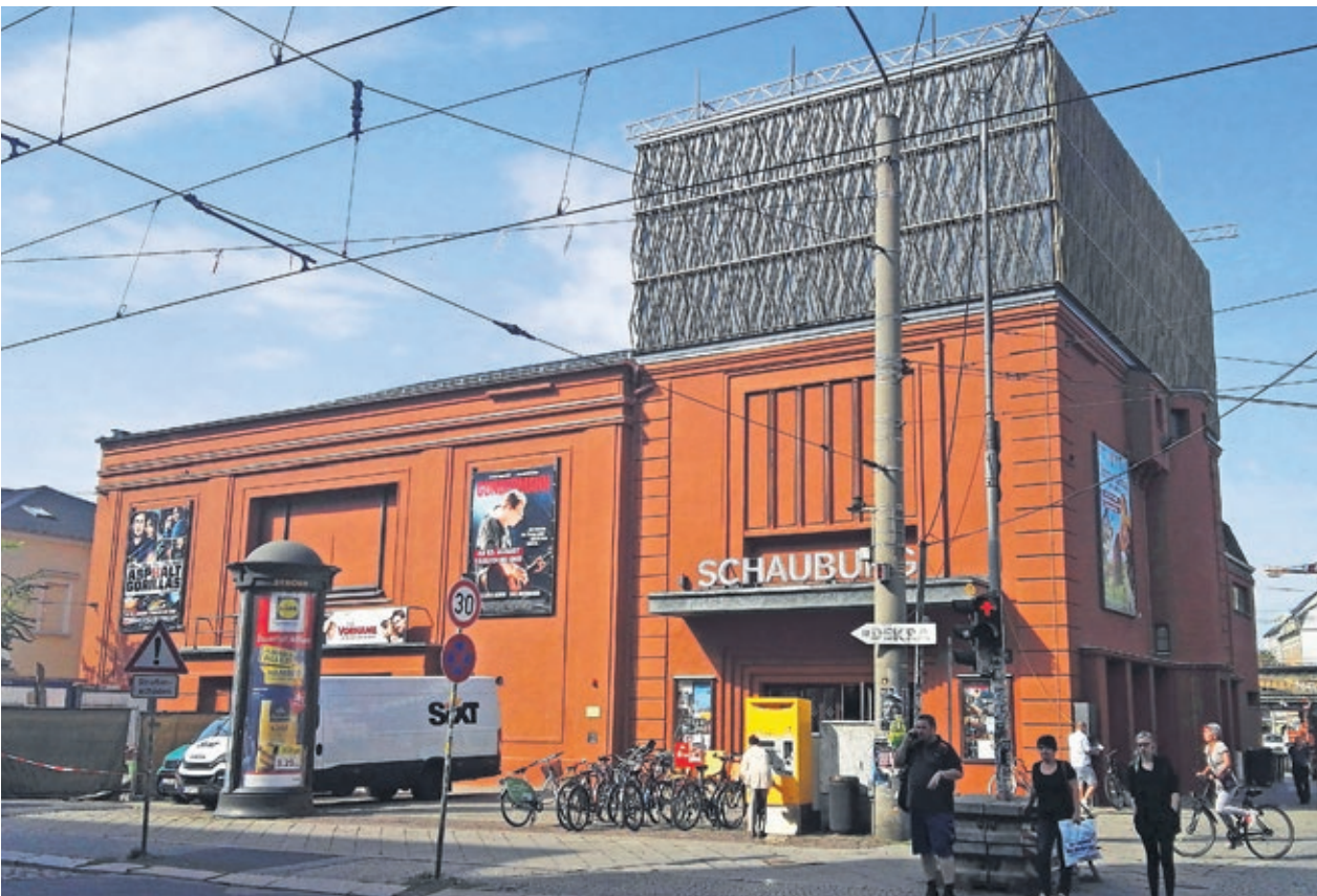
Schwierige Situation für die Kinos – in Dresden, wie überall

Was uns nach der Pandemie erwarten könnte und was man schon heute bedenken sollte – an einem Beispiel deutlich gemacht