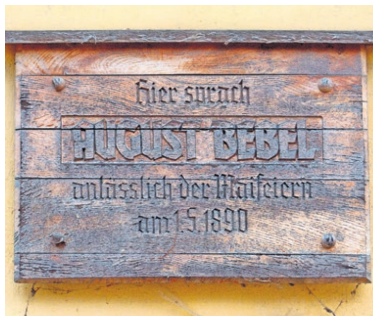
Gedenktafel an der Loschwitzer Schweizelei, Ulrichstraße 5

An jenem 1. Mai vor 131 Jahren muss schönes Wetter gewesen sein, als Dresdner Arbeiter das erste Mal ihren Kampftag begingen. Mehrere Tausend zogen aus der Stadt hinaus ins Grüne oder fuhren mit dem Dampfer bis nach Loschwitz, um in der »Schweizelei« August Bebel und Paul Singer zu hören. Die Vorsitzenden der Sozialdemokratischen Arbeiterpartei waren mit ihren Dresdner Genossen einig: Frauen und Männer folgten dem Beschluss des Internationalen Sozialistenkongresses in Paris vom Juli 1889, den 1. Mai als »Manifestation der internationalen Arbeiterbewegung« zu begehen. So geschah es. Weltweit demonstrierten Millionen Arbeiterinnen und Arbeiter im Zeichen ihrer internationalen Solidarität.