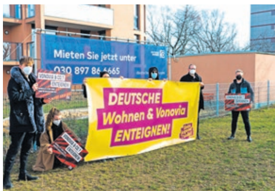
Dresdner Linksjugend bei Aktion gegen Immobilienkonzerne

So konnten über den Sommer hinweg Menschen ganz bequem und sicher von zu Hause aus elf Veranstaltungen lauschen. Von einer Einführung in den 3D-Druck bis zu Verschwörungsideologien wurde versucht jedes