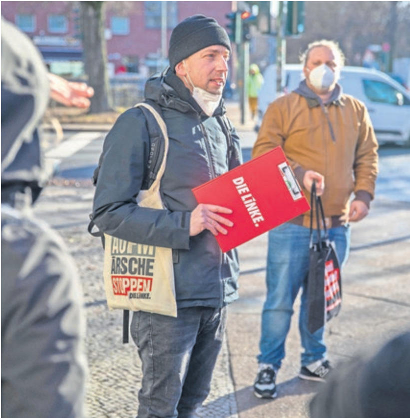
»Wie sprechen wir Menschen in unserem sozialen Umfeld an?« ist eine der Fragen, die wir uns bei »Bildung im Alltag« stellen