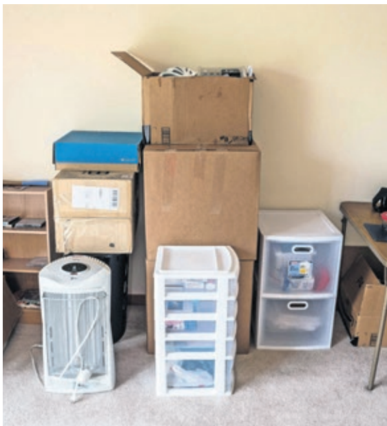
Bei drohender Zwangsräumung unterstützt das Sozialamt

Im Corona-Jahr 2020 ist die Anzahl der angezeigten Zwangsräumungen mit 532 zwar gestiegen (zum Vergleich: 2019 waren es 482, 2018 gab es 415 Anzeigen). Dennoch wurden 2019 mit 391 Räumungen deutlich mehr als im vergangenen Jahr tatsächlich auch voll-