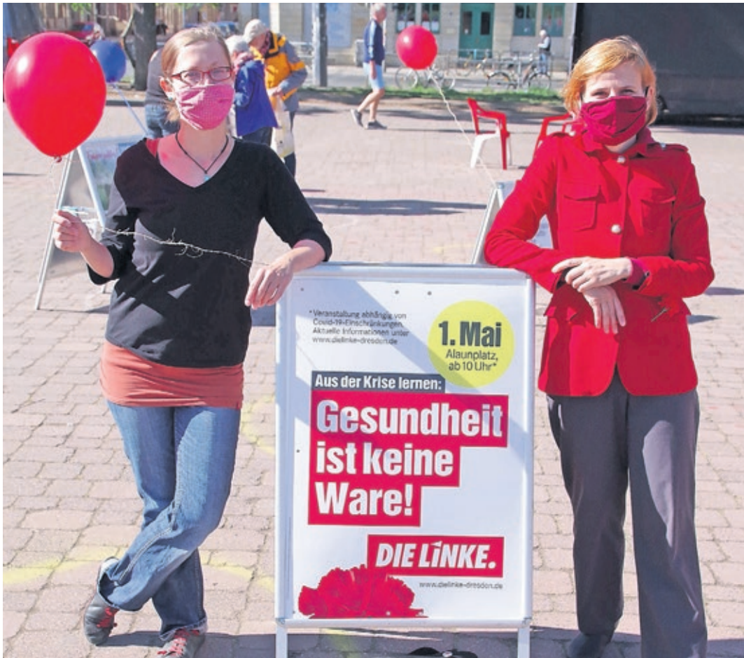
Premiere in der Pandemie: der 1. Mai 2020

Die diesjährige Maifeier auf dem Alaunplatz findet statt