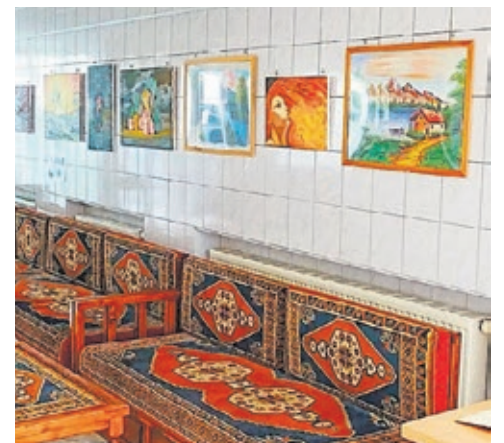
Von der Pandemie und den politischen Sanktionen gleichsam getroffen: Die Räume des kurdischen Kulturvereins in Dresden

Der Dresdner Verein Deutsch-kurdischer Begegnungen e.V. steht für kulturellen Austausch und die Vernetzung der kurdischen Community in Dresden. Seit 2015 sind die Vereinsräume in der Oschatzer Straße in Dresden ein wichtiger Begegnungsort im Stadtteil und ermöglichen es, den kurdischen Teil der Stadtgesellschaft besser kennen zu lernen. Normalerweise finden im Verein Vorträge und Lesungen, Ausstellungen und gemeinsame politische Treffen wie zum 8. März oder gemeinsame Essen statt. Diese Veranstaltungen sind kostenfrei, aber werden durch Spenden finanziert, welche dann wiederum für die Bezahlung der laufenden Kosten genutzt werden.