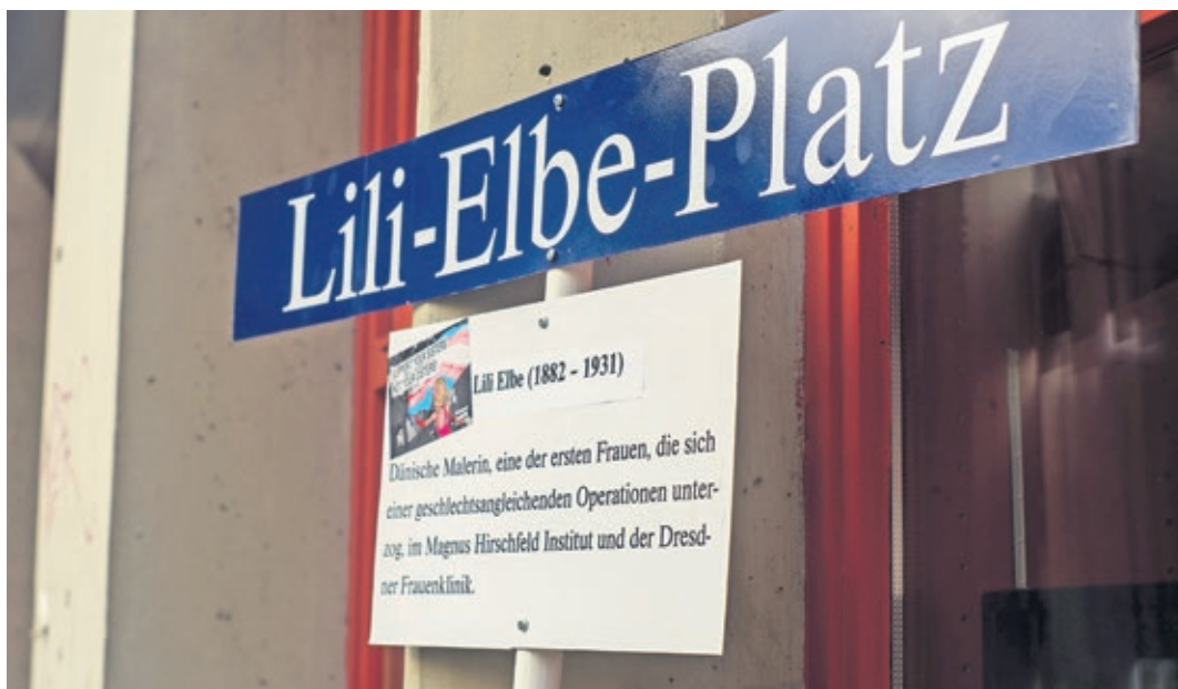
Umbenennung von Straßen und Plätzen mit fragwürdigen Namen

Mit den gesparten Geldern wollten wir sächsische Jugendarbeit unterstützen und haben dafür im Herbst zwölf Jugend- und Kulturzentren in Sachsen besucht, die dort Tätigen über ihre Arbeit und Probleme interviewt und mit Spenden unterstützt. Eines unserer Ziele war dabei auch der Rote Baum in Dresden. Die Interviews werden im Laufe der nächsten Monate über Podcasts auch für die Öffentlichkeitsarbeit verwertet. Nun steht als nächste große Aufgabe die Bundestagswahl auf dem Plan, für die wir ebenfalls ein basisbereichertes Wahlkomitee gründen werden und schon fleißig auf der Suche nach Unterstützer:innen sind. Ebenso wird versucht die Fahrt nach Bergen-Belsen nachzuholen. Wir hoffen, dass sich die Situation für das nächste Jahr verbessert und wir unsere politische Arbeit weiter ausbauen können. Bastian Stock