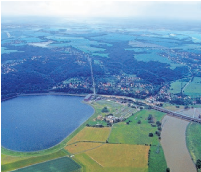
Wird seitens der Stadt keine Lösung gefunden, droht dem Stauseebad Cossebaude das Aus

Im letzten Jahr wurde bekannt, dass das Stauseebad in Cossebaude in Gefahr ist. Das Problem: Das Unternehmen Vattenfall, Betreiber des Pumpspeicherwerks Niederwartha, beabsichtigt dessen Stilllegung, da das Pumpspeicherwerk seine Nutzungsdauer inzwischen weit überschritten hat. Mit der Stilllegung des Pumpspeicherwerks drohen für das Stauseebad gravierende Konsequenzen, wie eine deutliche Absenkung des Stauziels im unteren Stausee und die damit faktisch notwendige Einstellung des Badebetriebs im unteren Staubecken.