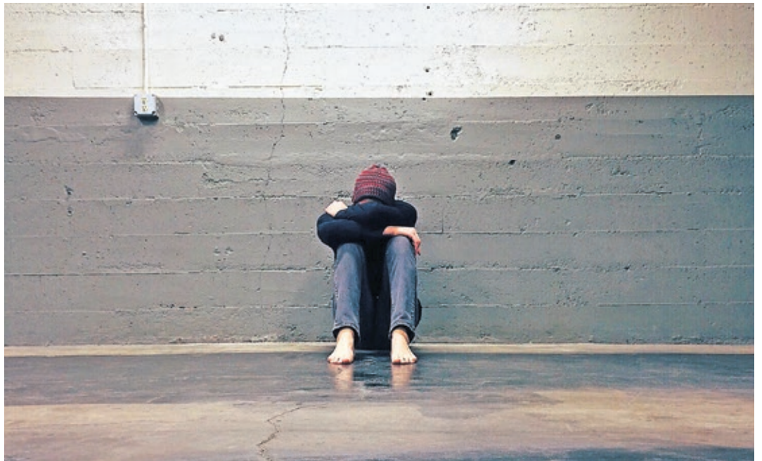
Zunahme von Depression ist nur eine der sozialen Folgen der Corona-Pandemie