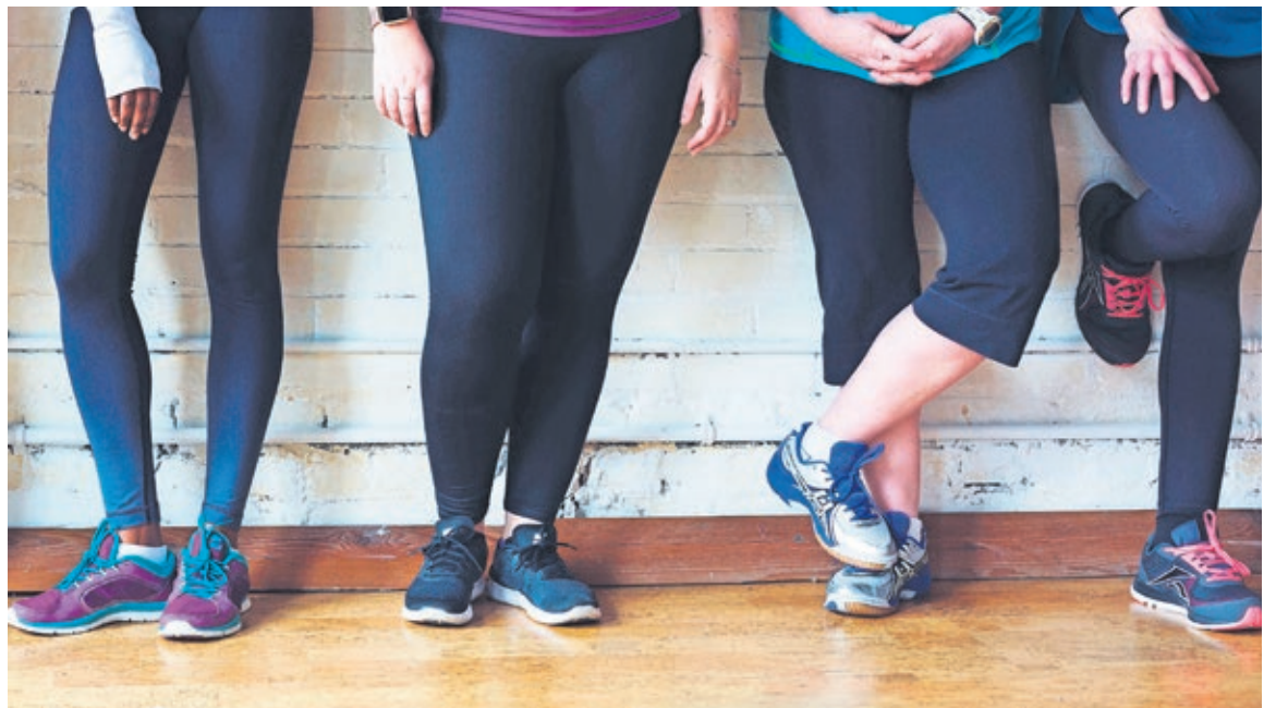
Das sportliche Angebot für Frauen in Dresden muss dringend unter die Lupe genommen und ausgebaut werden

Die Gleichstellung der Geschlechter ist eines der zentralen Themen linker Politik. Sie betrifft sämtliche Bereiche, so auch den Dresdner Sport