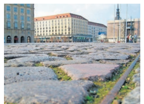
Gefährliches Pflaster: Dresdner Altmarkt