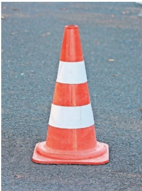
Ein Abbiegeverbot an der Dresdner Hainstraße würde den Verkehrsfluss deutlich verbessern

Die Innere Neustadt ist mit ihren vielen Hauptverkehrsstraßen besonders von Verkehrslärm betroffen. Autofahrer:innen versuchen Staus und Ampeln zu umfahren und verwandeln so die Innere Neustadt in ein wahres Schleichwegelabyrinth. Mit verschiedenen Maßnahmen wie Geschwindigkeitsreduzierungen, Straßeninstandsetzungen oder Abbiegeverboten soll hier Abhilfe geschaffen werden. Ein großer Streitpunkt im Stadtrat: Das Linksabbiegeverbot von der Hainstraße in die Theresienstraße. Dieses wird nun vorerst ausgesetzt bis zur Sanierung der Königsbrücker Straße. Danach soll es erneut Untersuchungen zu den Auswirkungen auf die Verkehrsmengen geben. Bisher wurden hier pro Tag 1100 Linksabbieger:innen